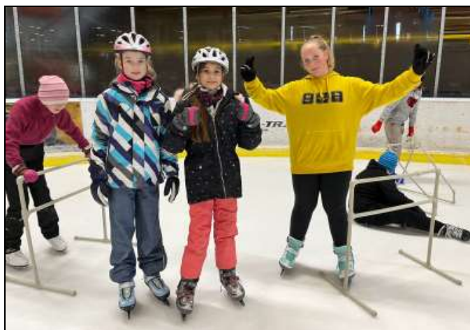
15. 12. 2023 – Bruslení žáků 6. a 7. ročníku v Benešově