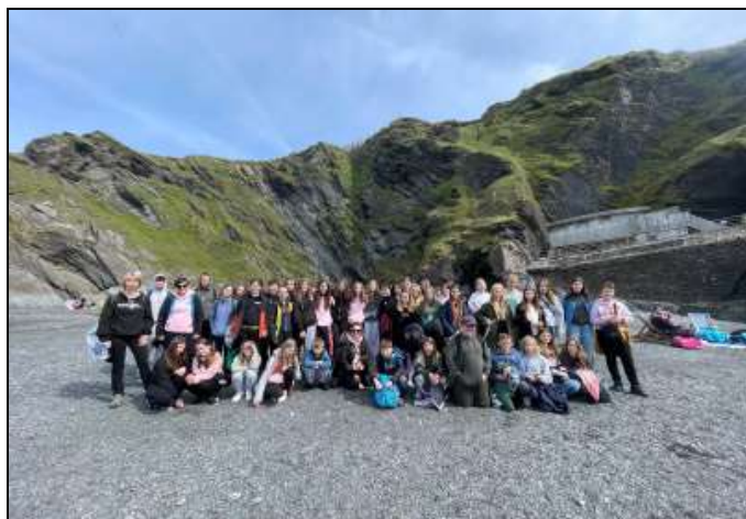
20. 04. – 26. 04. 2024, Jazykový zájezd Anglie, Ilfracombe