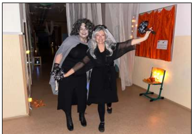
31. 10. 2023 – Halloweenská cesta temnou školou