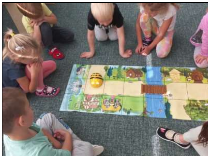
27. 09. 2023 – Programování robotických včelek „Beebot“