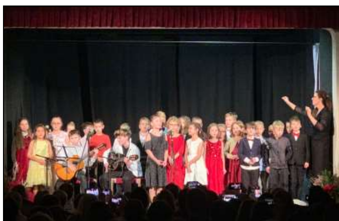
19. 12. 2023 – Vánoční akademie