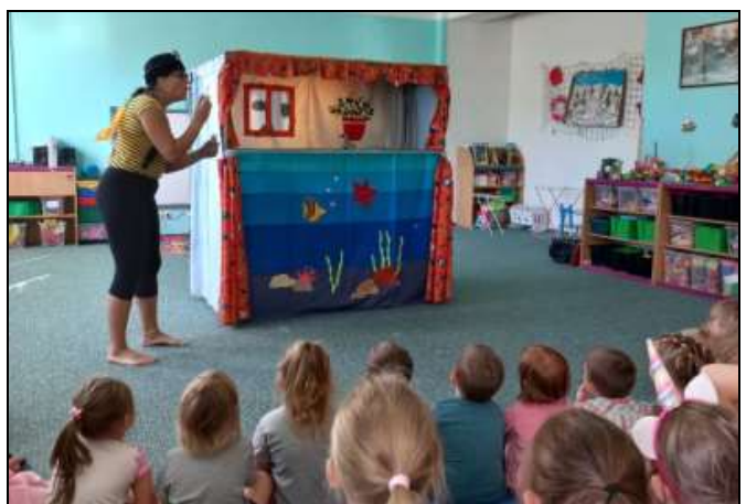
18. 06. 2024 – Divadlo Koloběžka, Hurá na prázdniny