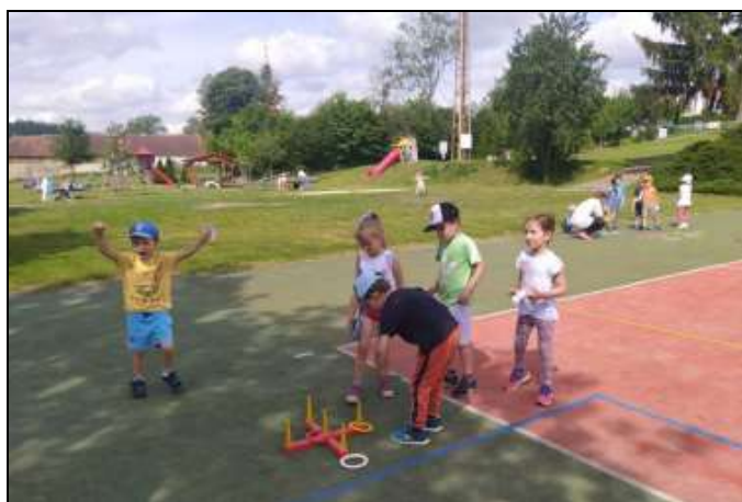
31. 05. 2024 – Dětský den