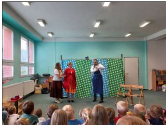
26. 9. 2023 – KRC Barrandov, Rozmarné putování