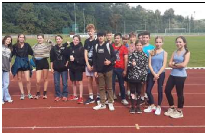
04. 10. 2023 – Atletická všestrannost ve Vlašimi