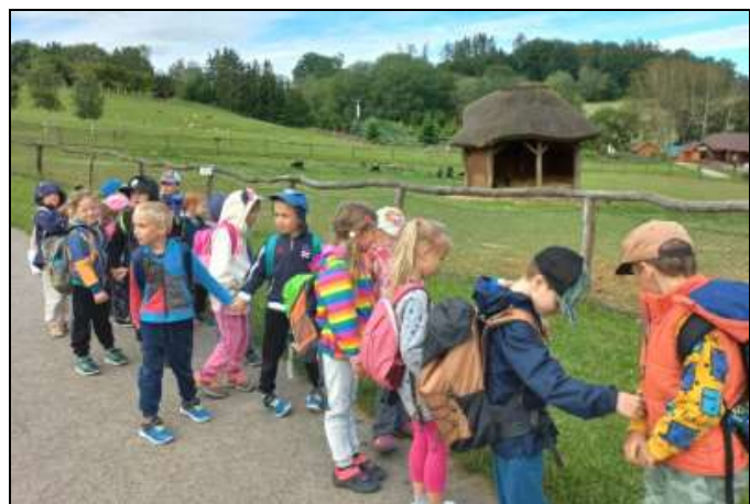
11. 06. 2024 – Farmapark Soběhrdy