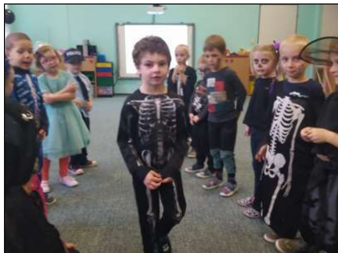
31. 10. 2023 – Halloween