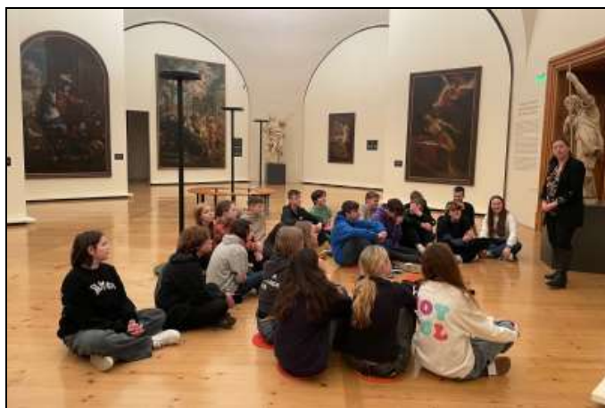
20. 02. 2024 – Hledání baroka ve Schwarzenberském paláci, 8. tř.