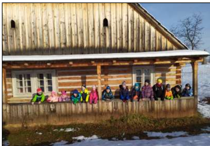
08. 12. 2023 – Exkurze 2. B do skanzenu v Kouřimi