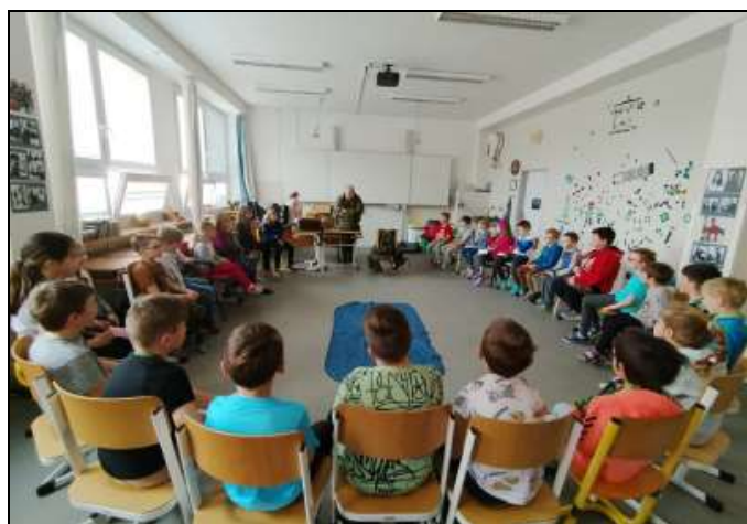
27. 03. 2024 – Příprava občanů k obraně státu