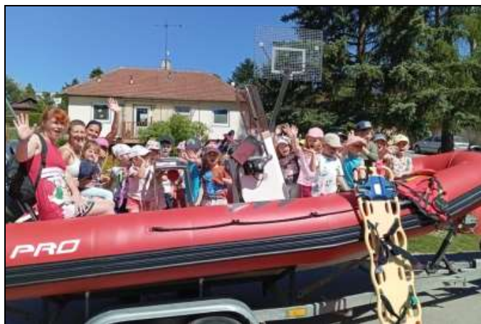
15. 05. 2024 – Den ochrany člověka za mimořádných událostí