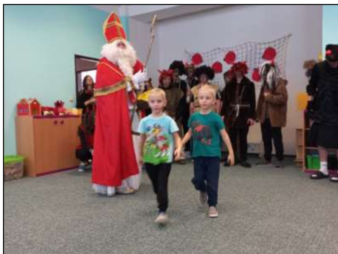
05. 12. 2023 – Mikulášská nadílka