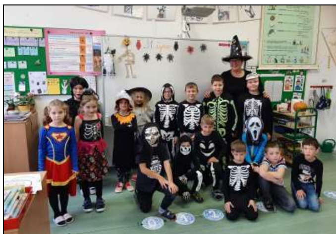
31. 10. 2023 – Halloween ve 2. B