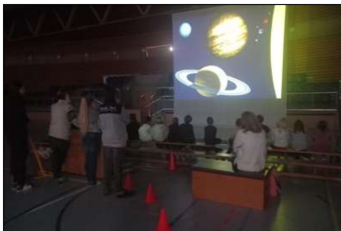
30. 01. 2024 – Přednáška o vesmíru v Sázavě, 4. tř.