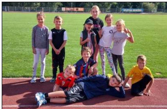
05. 10. 2023 – Atletická všestrannost v Benešově