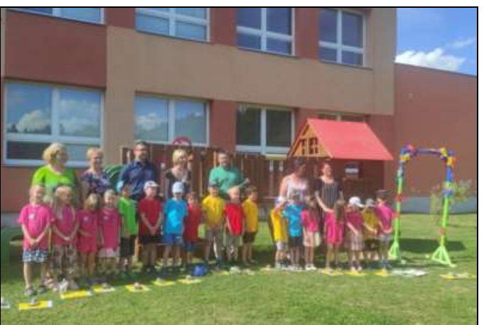
18. 06. 2024 – Pasování předškoláků na školáky