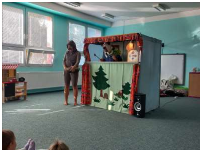
11. 9. 2023 – Divadlo Koloběžka, Co mají medvědi o podzimu nevědi

Fotografie z projektů, exkurzí, výletů a dalších akcí školy se nacházejí na www.zsmschocerady.cz v sekci Galerie a na Facebooku školy.