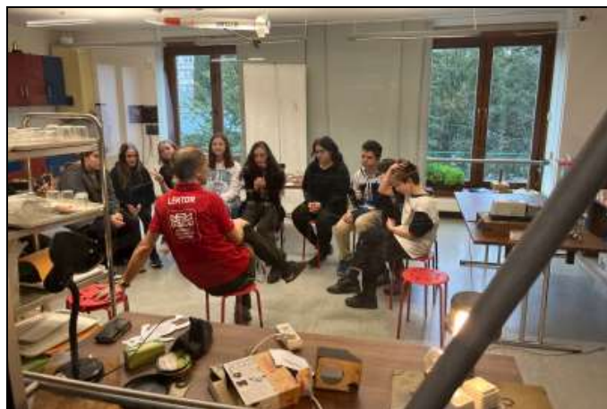
05. 03. 2024 – Národní technické muzeum, 7. tř.