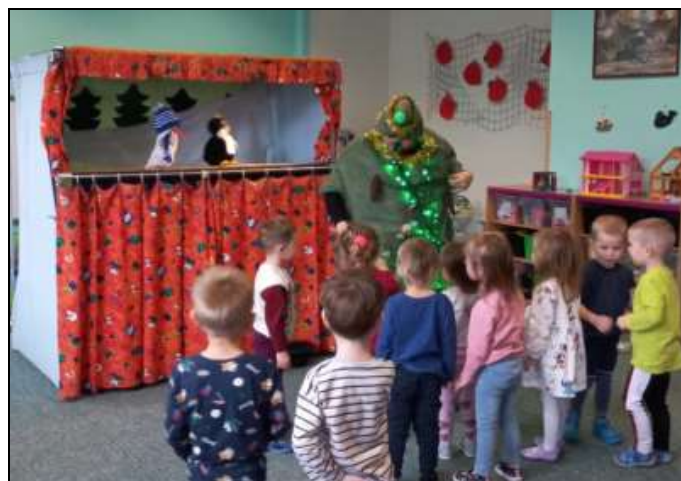
04. 01. 2024 – Divadlo Koloběžka, Popletená zimní pohádka