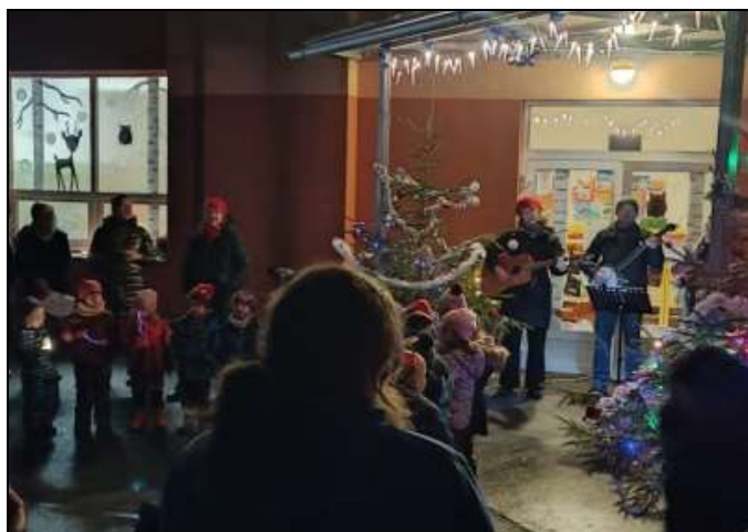
13. 12. 2023 – Česko zpívá koledy